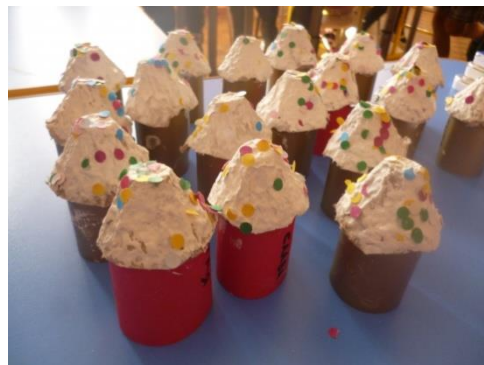
Стаканчики из под йогурта, ватные диски, бусинки.