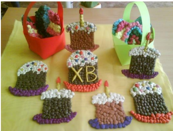
Из фасоли, камешков и т.п.